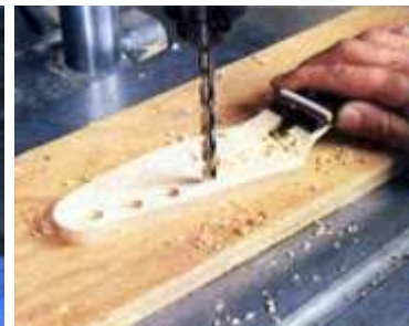
9. Trace cuidadosamente los espacios de los agujeros para las clavijas y perfórelos usando un taladro de banco. Se utiliza una tabla como respaldo para evitar el hacer desgarraduras.