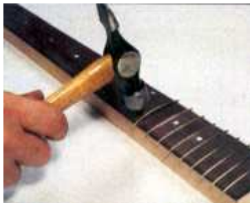
7. Instale los trastes doblándolos en una curva más cerrada que la de la tabla. Luego, martille los extremos en su lugar y golpéelos de un lado al otro ligeramente para asentar bien el traste.

Corte los lados de la ranura de la cejilla a la profundidad debida y añada una ranura aserrada en el medio. Encole la cejilla en su lugar, lime los extremos y recorte el alto a las dimensiones que se muestran. Sitúe los agujeros de las clavijas y taládrelos en un taladro de banco (Foto 9). Dele forma e instale en la cabeza el bloque que cubre la varilla tensora.