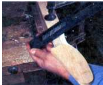
8. Empleando una herramienta Surform podrá darle su forma a la parte posterior del mástil. Seguidamente, vaya alternando este proceso del acabado usando un cuchillo raspador y lija.