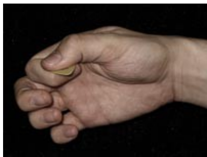
Fotografía 1: Todo guitarrista debería pararse a pensar un minuto cómo coge la púa; si lo hiciéramos bien desde la base, no tendríamos problemas a la hora de aplicar técnicas más avanzadas.

Ahora, atacad la cuerda con la púa. Puede que al principio resulte incómodo, pero es necesario echarle horas al asunto. Experimenta con el ángulo de ataque de la púa sobre las cuerdas. Para un ataque limpio, músicos, como Ynwie J. Malmsteen o Michael Romeo, atacan con la púa totalmente plana (FOTO2). Sin embargo, esta posición puede resultar incómoda a la hora de mover la muñeca. Es más, la mayor parte de los guitarristas lo consideran como tal, y prefieren angular un poco la púa hacia abajo. Esto provoca que el sonido suene más “rasposo”, muy propio para rock. (FOTO 3) Por otra parte, tenemos el extremo opuesto: angular hacia arriba. Empleada por músicos como Shawn Lane, el resultado es un sonido más redondo y lleno. (FOTO4)