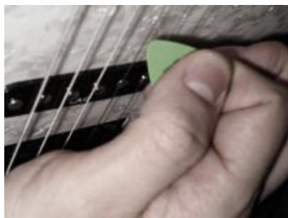
Fotografía 3: Púa angulada hacia abajo. Obtenemos un sonido rasposo y roquero.