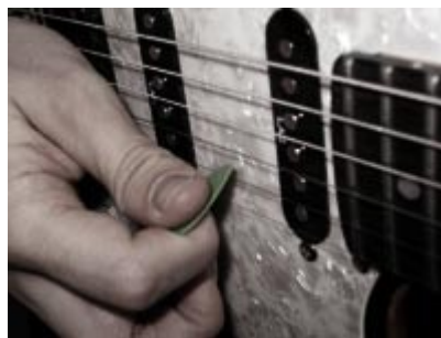
Fotografía 4: Púa angulada hacia arriba. Obtenemos un sonido lleno.