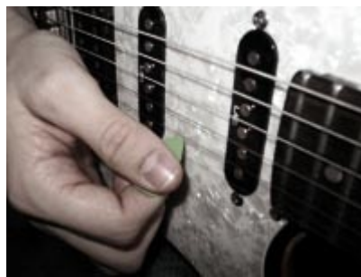
Fotografía 2: Púa plana, como Malmsteen o Romeo.