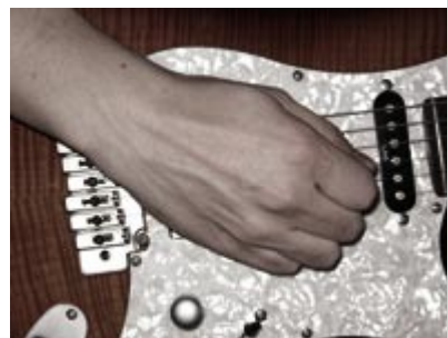
Modo tradicional de jazz