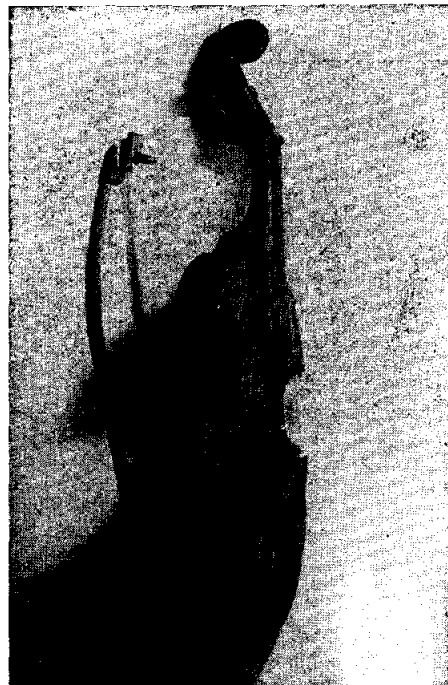
El mismo, de perfil, posición que permite conocer sus verdaderas dimensiones.