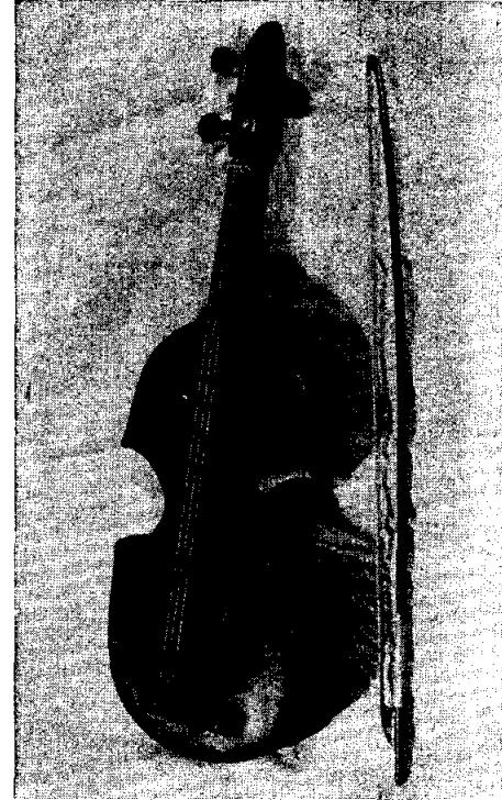
Un modelo intermedio de rabel chileno, procedente de Colchagua.