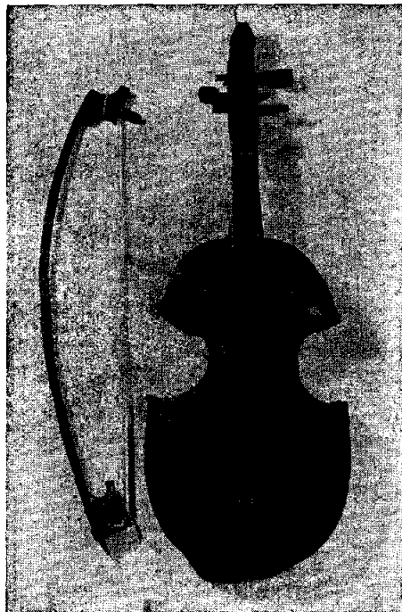
El rabel colonial de Santiago, en posición frontal.